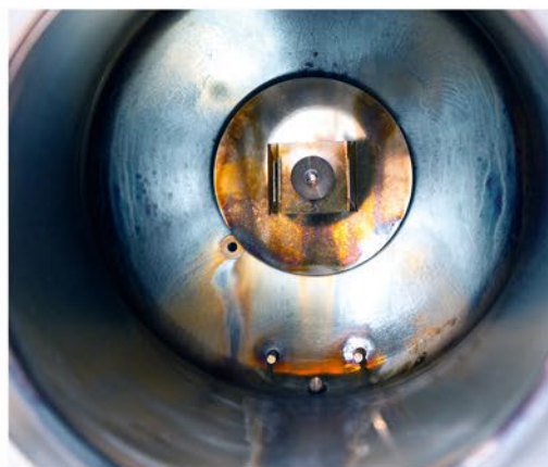
Ohne regelmäßige Kesselreinigung