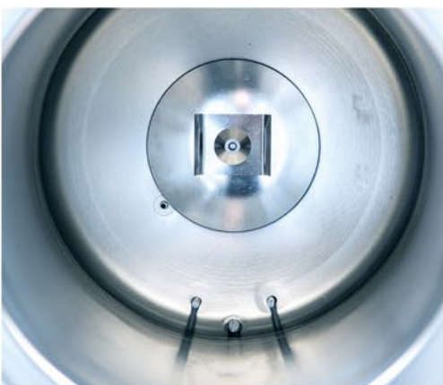
Mit regelmäßiger Anwendung von Chamber Protect