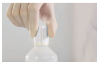
Kappe im Uhrzeigersinn bis zum Anschlag drehen, dadurch wird der Öffnungsbereich der Flasche durchstoßen.

Zum Öffnen der Flasche weißen Abstandsring entfernen und Verschlusskappe wieder fest aufschrauben.